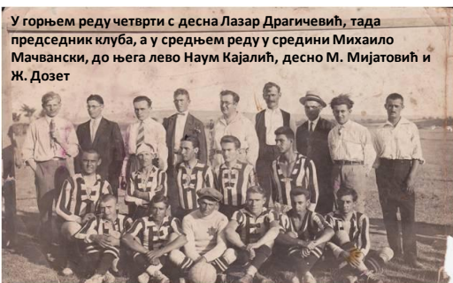
Најстарији снимак из 1925. године