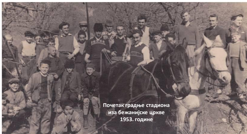
Почетак градње стадиона иза бежанијске цркве 1953. године