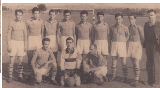
Први тим из 1947. године