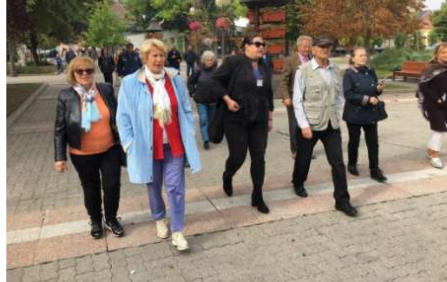
Шетња у центру Вршца