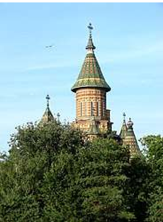
Саборна Црква у Темишвару