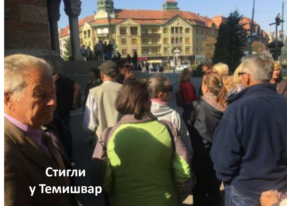
Стигли у Темишвар