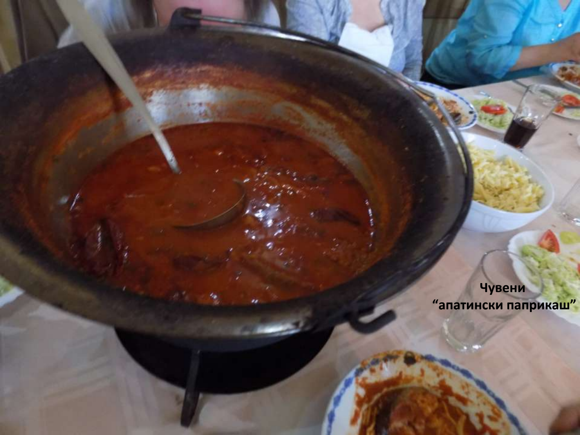
Чувени “апатински паприкаш”